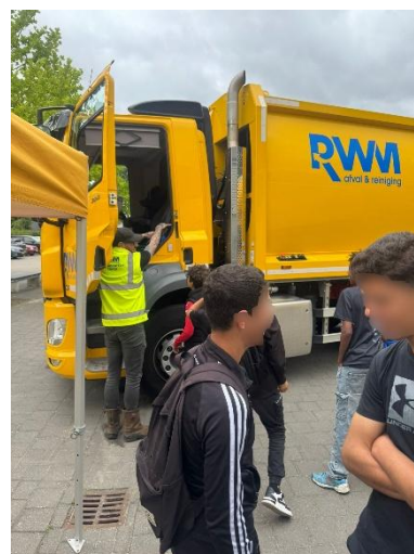
Leerlingen van EOA maken kennis met de wereld van de afvalverwerking. Met dank aan RWM.